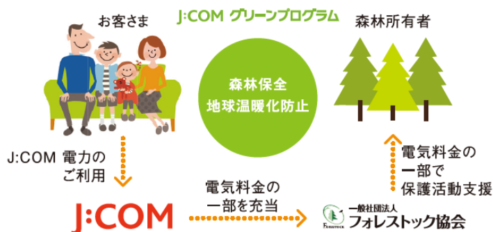
【J:COM グリーンプログラムの仕組み】

J:COM では、社会の一員として、よりよい未来のため、積極的にCSR 活動を行い、地域に根差した企業として地域と社会に貢献してまいります。